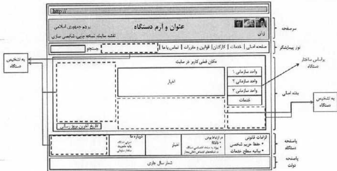
شکل ۱: فرمت استاندارد برای صفحه اصلی تارنمای دستگاه

به منظور حفظ وحدت رویه در دستگاه‌های زیرمجموعه دولت، کلیه دستگاه‌های اجرایی موظفند از یک فرمت پایه واحد در طراحی و چیدمان مطالب تارنما خود پیروی نمایند. شکل ۱ نمای شماتیک مطالب موجود در صفحه اصلی تارنما و نحوه چیدمان آنها را با در نظر گرفتن اندازه صفحه رایانه شخصی نشان می‌دهد.